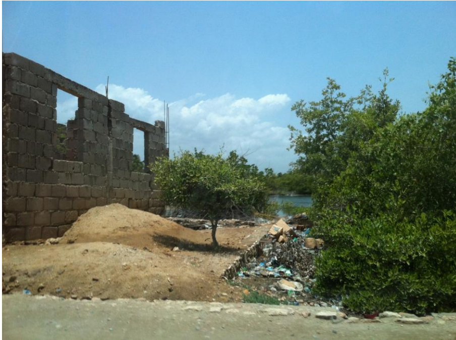
↑ O STRADĂ DIN HAITI, IULIE 2012